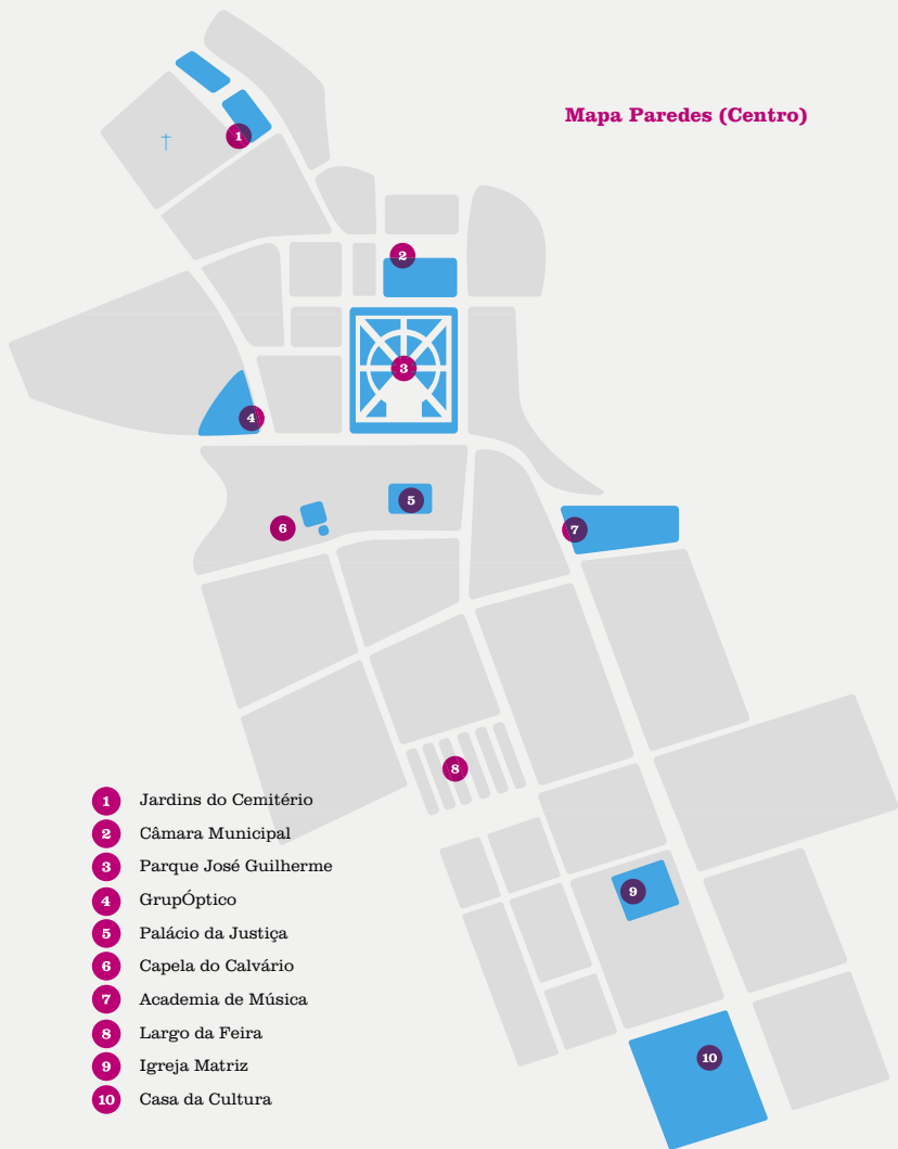
Mapa Paredes (Centro)